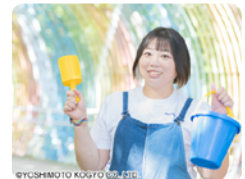
砂場研究者・どろだんご先生